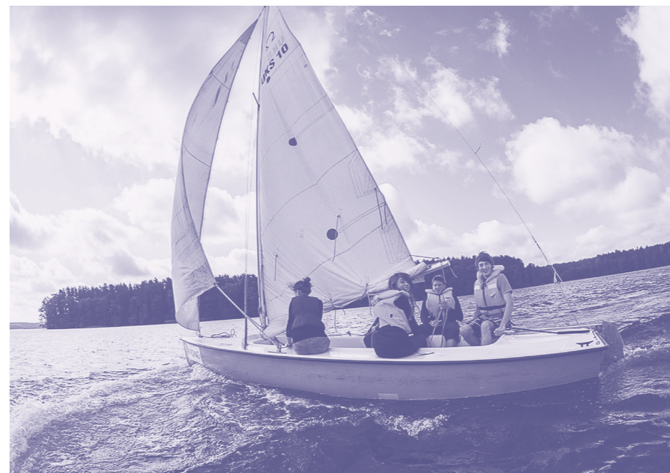
Wakacje Stypendystów Horyzontów

Program Stypendialny Horyzonty Fundacji EFC działa od 2009 roku. Oferujemy wsparcie uczniom z małych miejscowości oraz rodzin o skromnych dochodach, którzy chcą uczyć się w najciekawszych liceach i technikach w kraju. Dodajemy odwagi, uczymy współpracy, angażujemy społecznie. Dbamy o rozwój osobisty w szkole i poza szkołą.