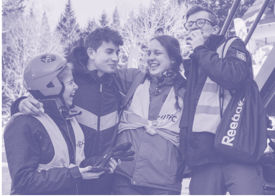
Ferie w Karpaczu 2019