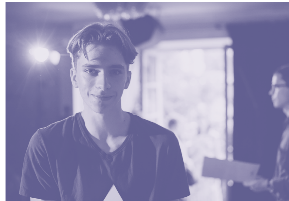
Impreza maturzystów, Warszawa 2018